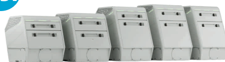
ÚJ AW sorozat hosszesztergákhoz