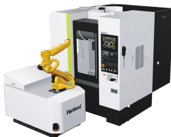
S-PLUS 8 adagoló robottal