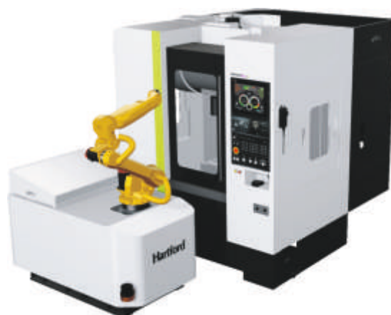
S-PLUS 8 adagoló robottal