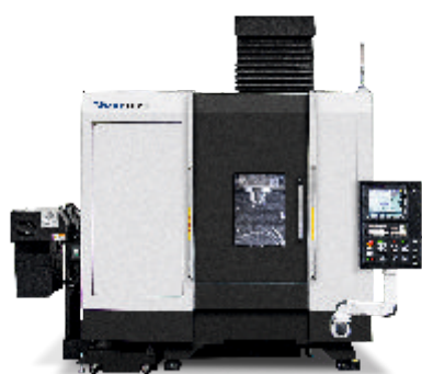
KF7300 5A MEGMUNKÁLÓKÖZPONT