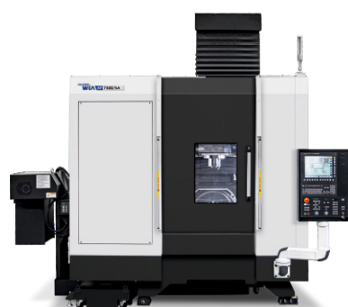
KF7300 5A MEGMUNKÁLÓKÖZPONT